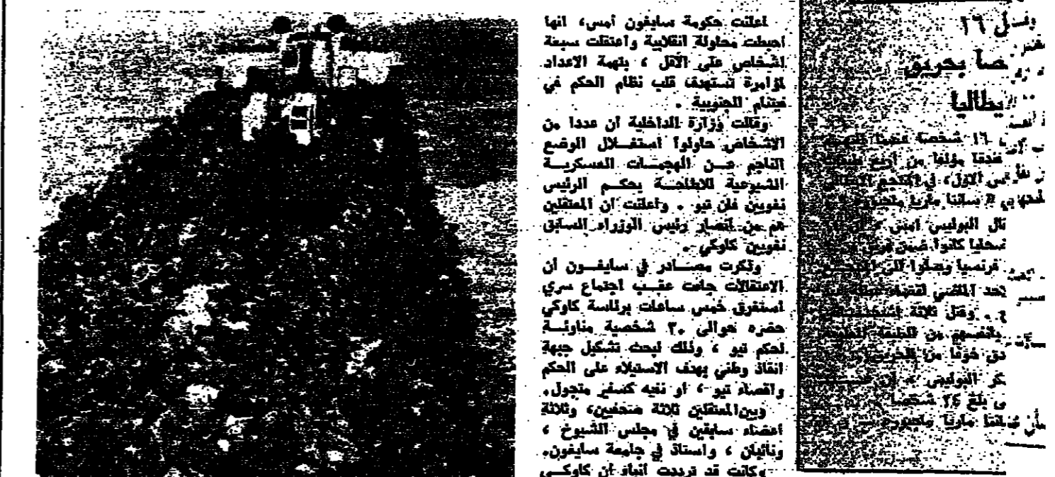
خود نيناميون جنوبيون في قاربهم في اناء السحابهم من المواقف المحيطية بحديقة هوي عاصمة الطائرة القديمة ، الى نونغ